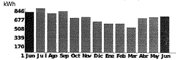
Consumo últimos 13 meses (kWh)

Consumo referencia: 809 kWh (30 días) Límite de Invierno: 711 kWh (30 días)