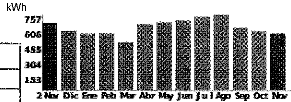
Consumo últimos 13 meses (kWh)