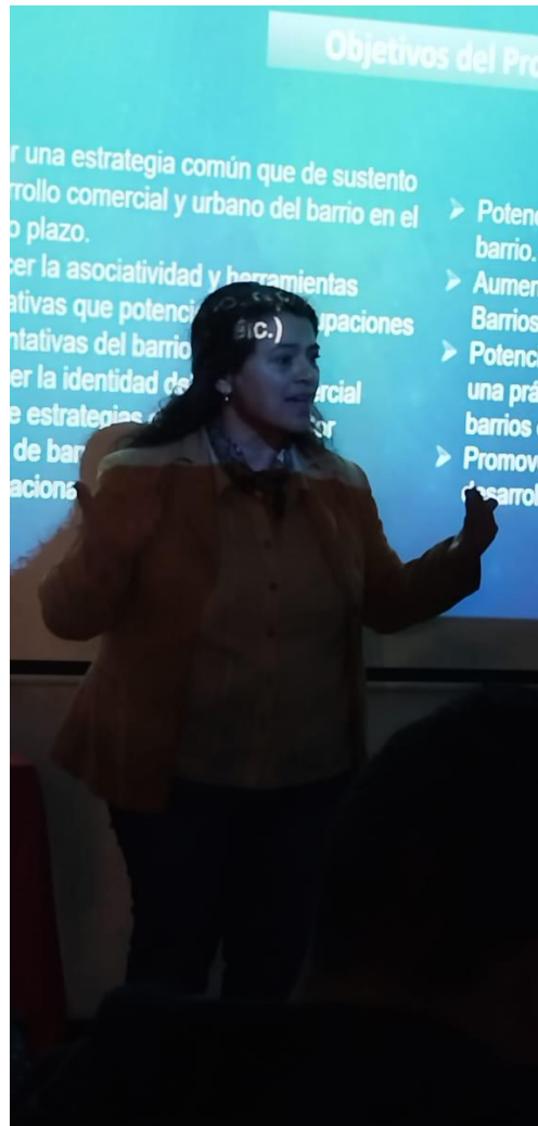
Formulario Postulación ajustado para validación contraparte Sercotec.