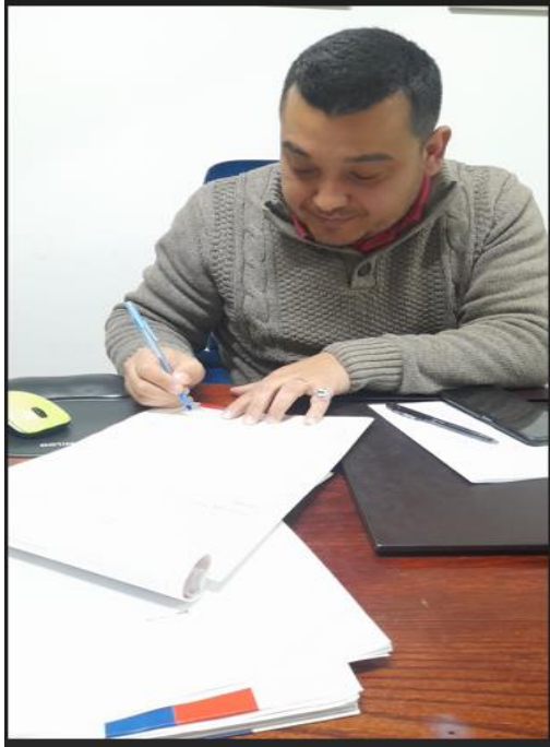
Reunión con Barrio Comercial Gastronómico de Graneros, 09 de septiembre, 2024.