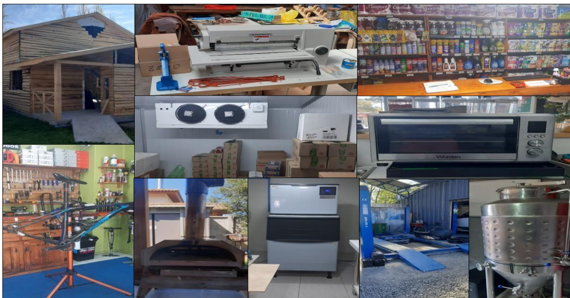
Imagen 6: Fotografías tomadas en las visitas a terreno.

Durante la última semana del mes de septiembre se realizaron visitas presenciales a una parte del total de beneficiarios que habían rendido gastos dentro del mes de agosto, las visitas buscaban conocer in situ la implementación de los Planes de Trabajo, de esta forma se tendrá una visión general del proceso completo del Fondo Crece con todas aquellas observaciones que nos permitan visualizar mejoras en los futuros procesos de los proyectos que se abran, cada visita fue respaldada con un acta con observaciones y fotografías que muestran lo implementado.