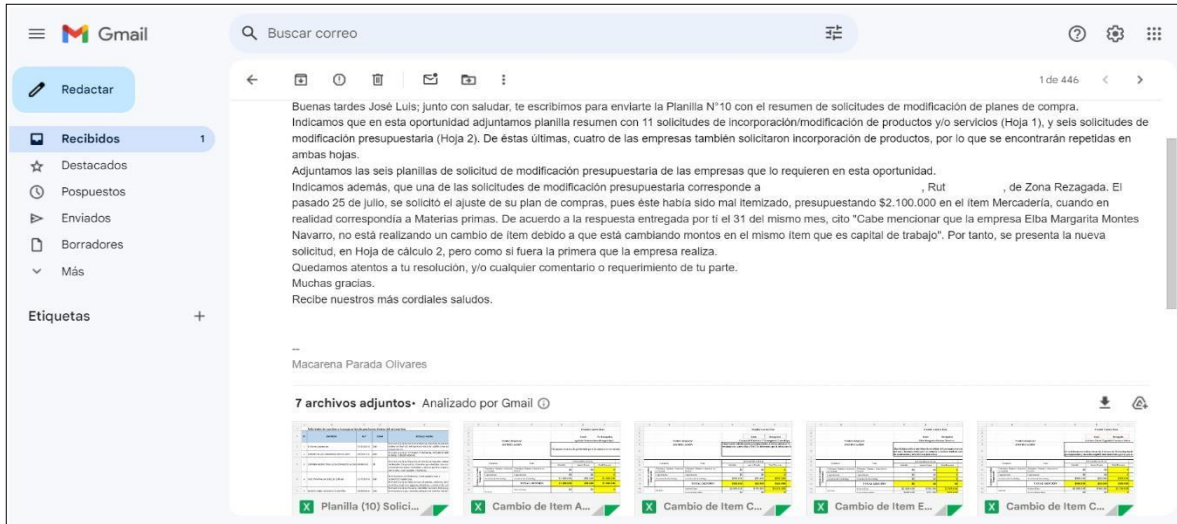
Imagen 1: Correo N°17 enviado por el agente operador con solicitudes de modificación de los Planes de trabajo.

Una vez recibidas las planillas se analizó la pertinencia de la solicitud caso a caso, una vez aprobadas se procedió a completar cada una con la fecha de aprobación (imagen 2) y fueron alojadas en la Carpeta Compartida diseñada para el proceso a la espera de que el Ejecutivo de Fomento a cargo del programa realizara la aprobación final y diera respuesta formal al Agente Operador quien finalmente gestionó la respuesta a cada uno de los empresarios que realizaron las solicitudes.