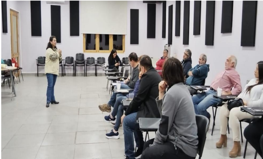
Reunión con encargada de Fomento Productivo y comerciantes de Malloa