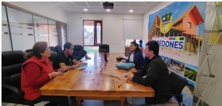
Reunión con Encargado de Fomento Productivo y presidenta de Cámara de Comercio y Turismo de Paredones