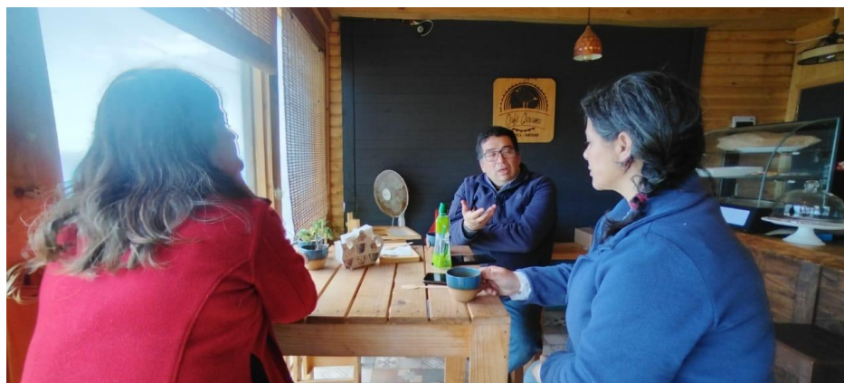
Reunión cámara encargada de Fomento Productivo y cámara de comercio de Navidad