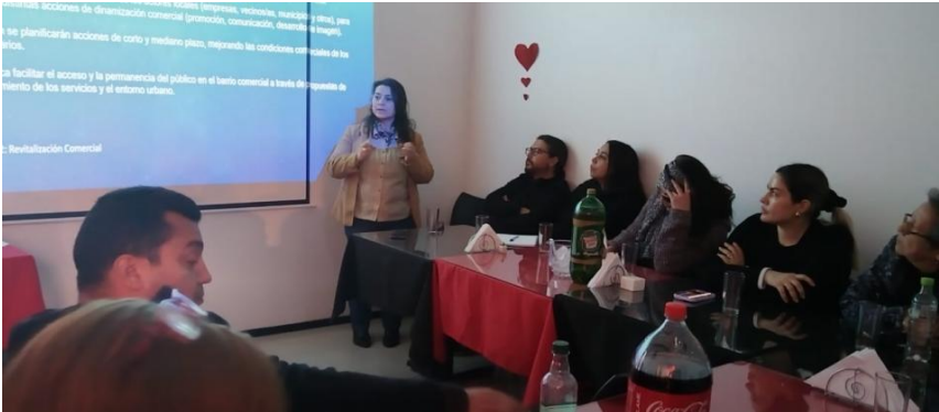
Reunión con comerciantes de calle Estado de Rancagua