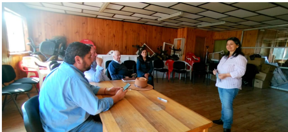
Reunión con Cámaras de Comercios de Pichilemu y Cauhuil

Video resumen explicativo de formulario de postulación al Programa BBCC que es presentado en las reuniones con agrupaciones de comerciantes.