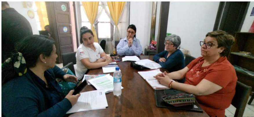
Reunión con encargada de Fomento Productivo y Cámara de Comercio de Las Cabras