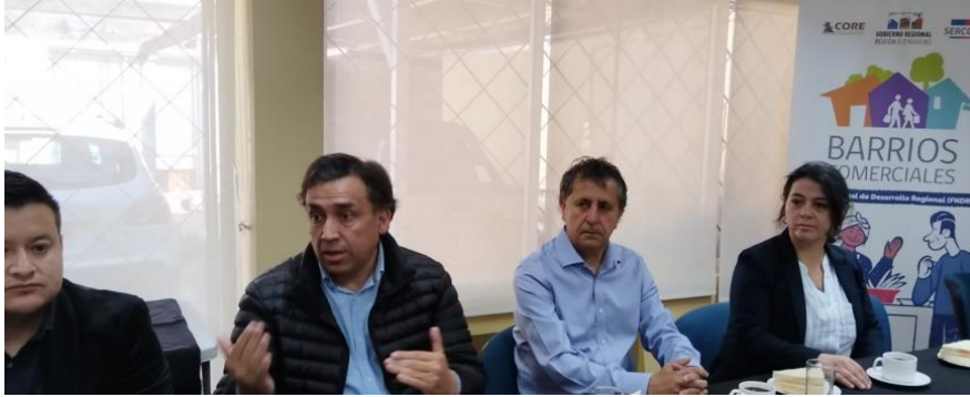
Reunión con la prensa para difusión alcances Programa BBCC