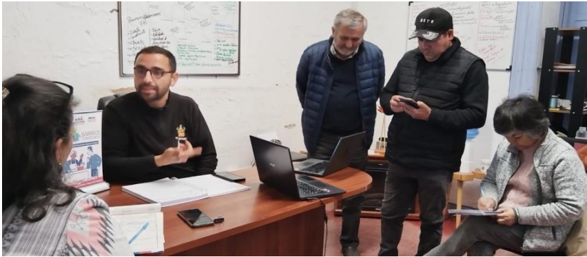
Reunión con encargado de Fomento Productivo y Cámara de Comercio de Lolol