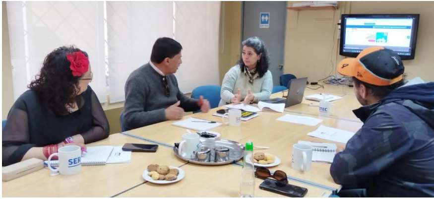
Reunión con agrupación Comercio Seguro de Rancagua