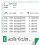
Auxiliar Octubre ...